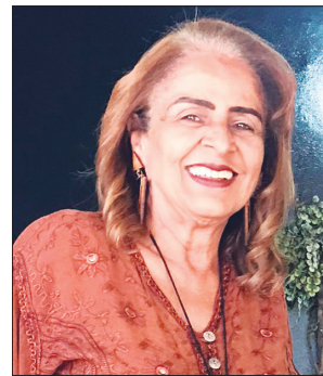
Autora: Professora Arlete de Faria Capelari