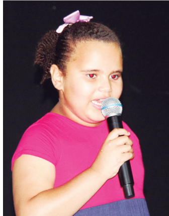
Esther cantou a música "Jogo do Amor" do MC Pedrinho